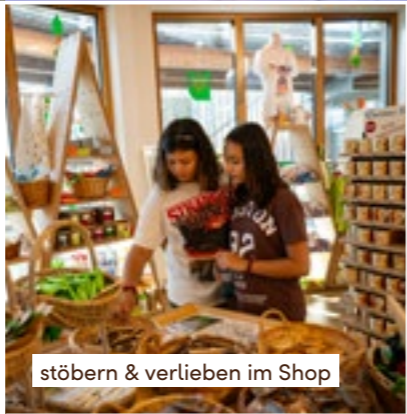
stöbern & verlieben im Shop

Tickets gibt es vor Ort am Eingang des Baumwipfelpfads. Online-Tickets in Kombination mit der Grünberg-Seilbahn oder auch Gutscheine findet ihr unter www.treetop-walks.com/salzkammergut .