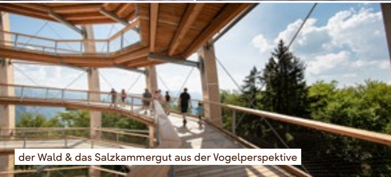
der Wald & das Salzkammergut aus der Vogelperspektive