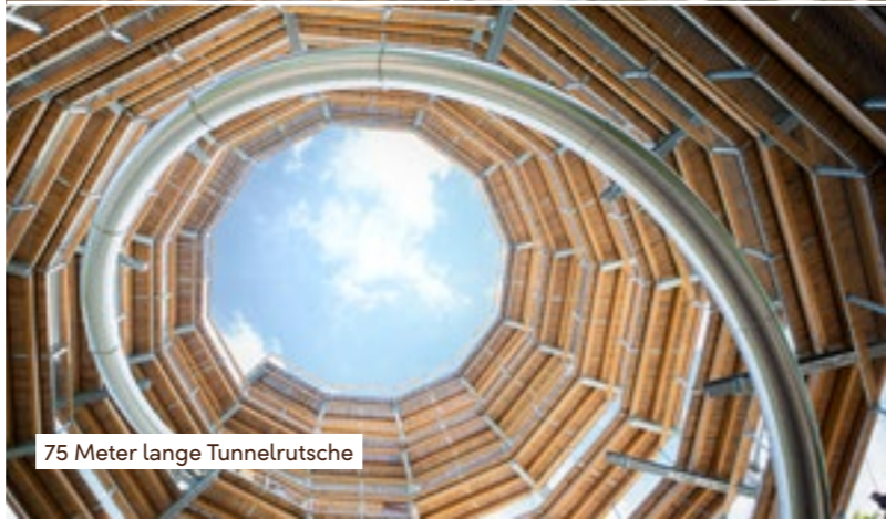
75 Meter lange Tunnelrutsche