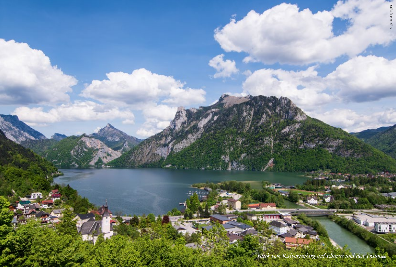
Blick vom Kalvarienberg auf Ebensee und den Traunsee