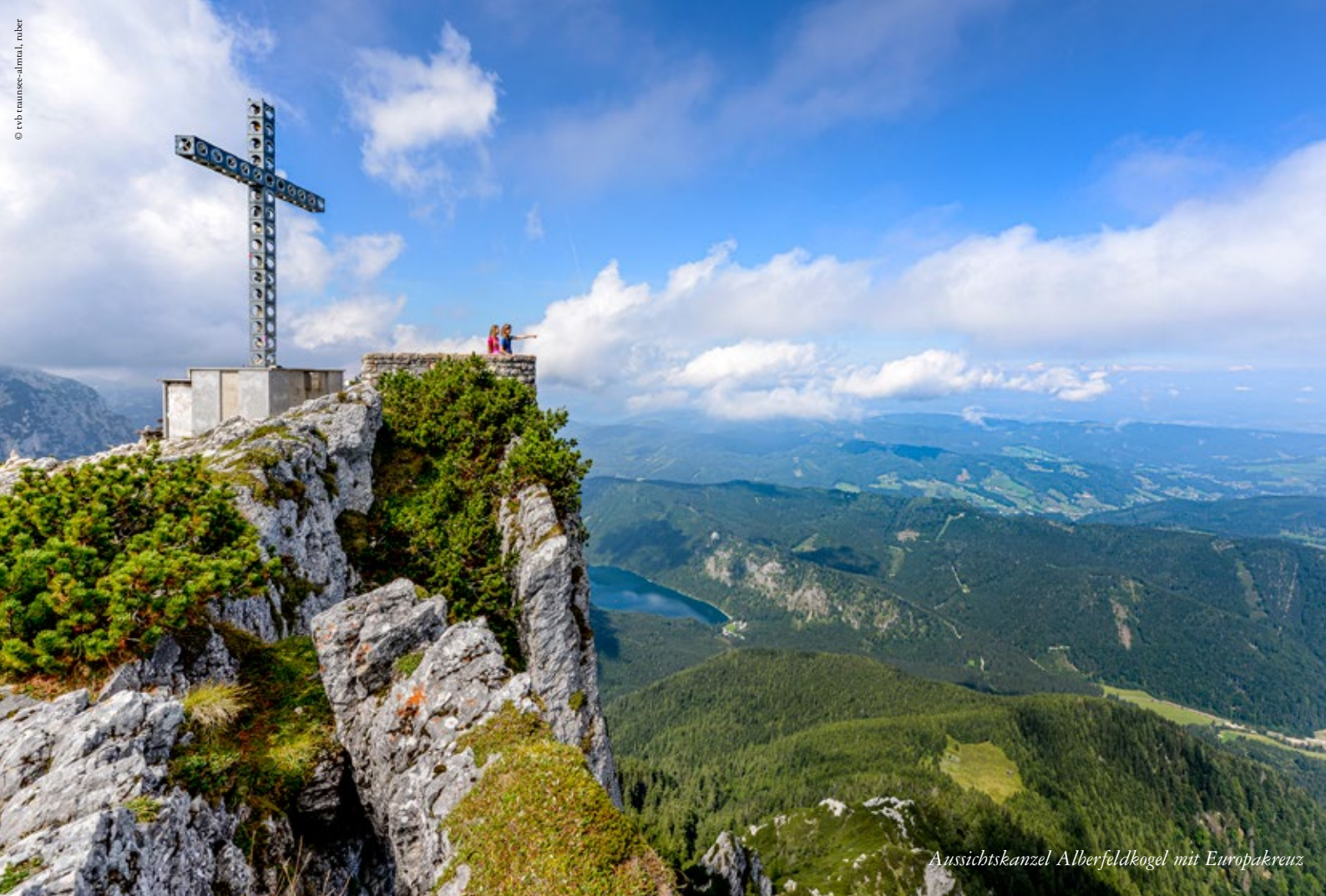
Aussichtskanzel Albersfeldkogel mit Europakreuz