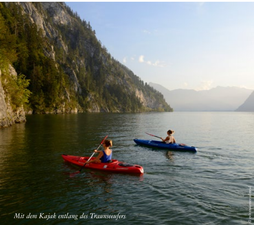
Mit dem Kajak entlang des Traunseeufers