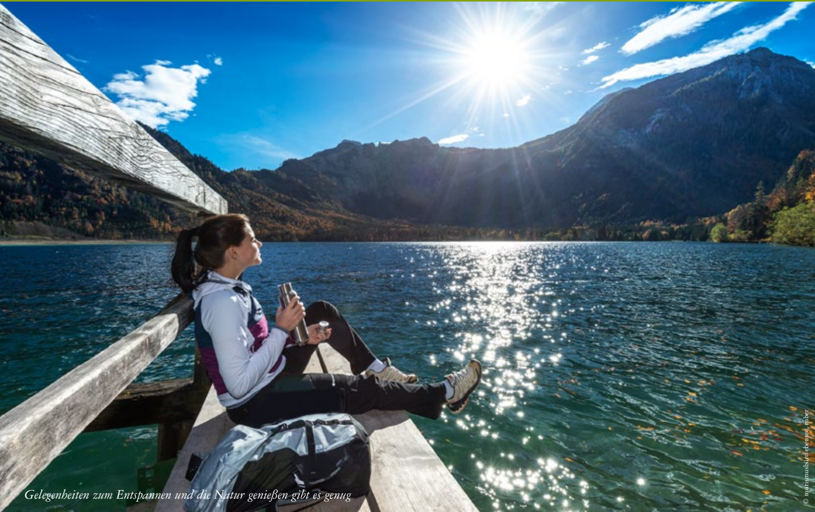
Gelegenheiten zum Entspannen und die Natur genießen gibt es genug